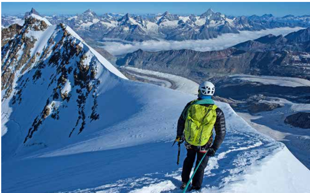
Tram entre els dos pics de Lyskamm. Al fons despunten, d'esquerra a dreta, el Cerví, la Dent Blanche, Ober Gabelhorn, Zinalrothorn i Weisshorn.