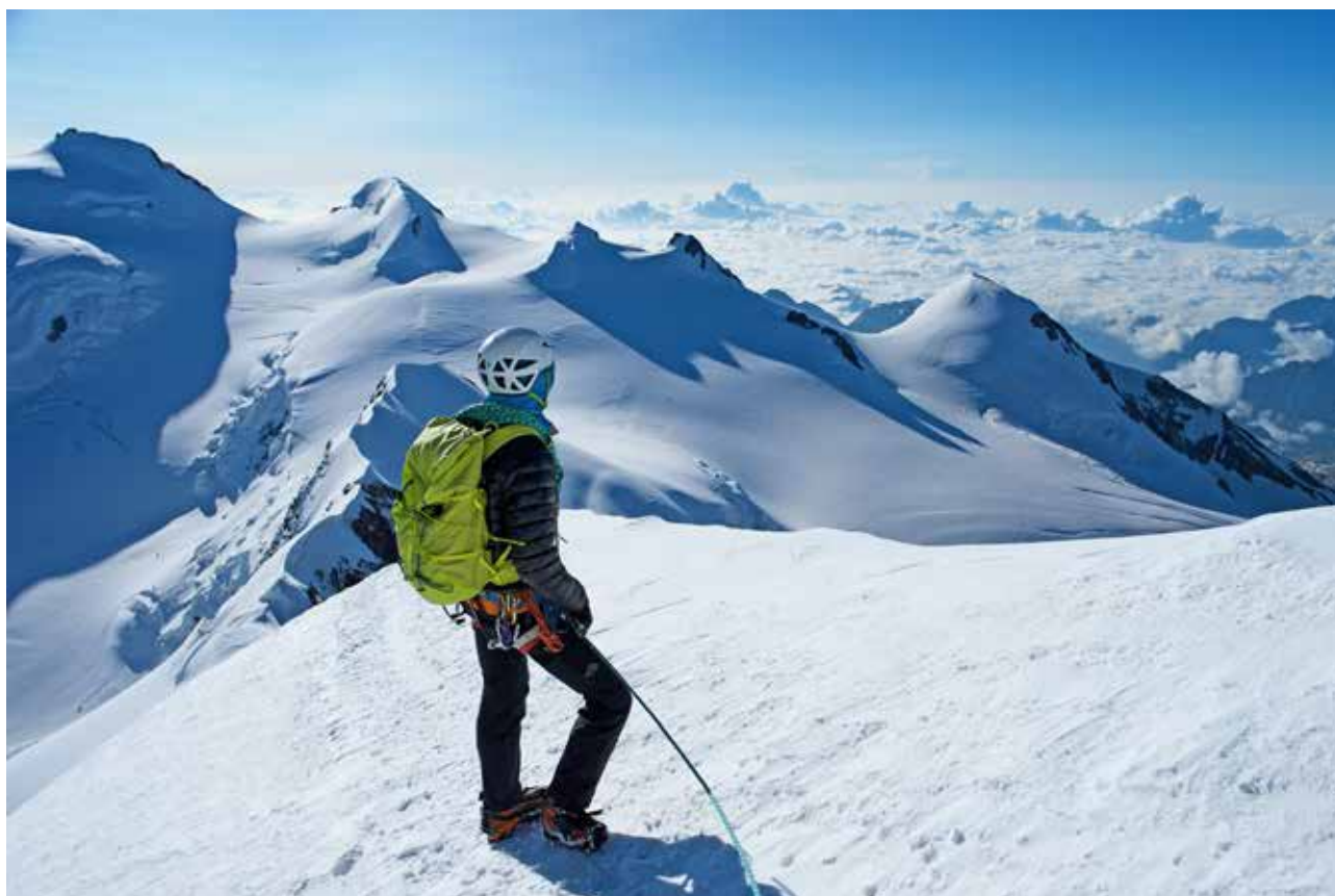
La travessa ofereix la vista dels cims del Monte Rosa. D'esquerra a dreta, Punta Gnifetti, Punta Parrot, Ludwigshöhe, Corno Nero i Piràmide Vincent.

La travessa dels pics de Lyskamm, al massís del Monte Rosa, és una aventura sublim, possiblement una de les més belles dels Alps. L'estètica del recorregut resulta extraordinària, des del principi fins al final, i moure's en equilibri tan a prop del cel implica convertir-se en funàmbuls per un dia.