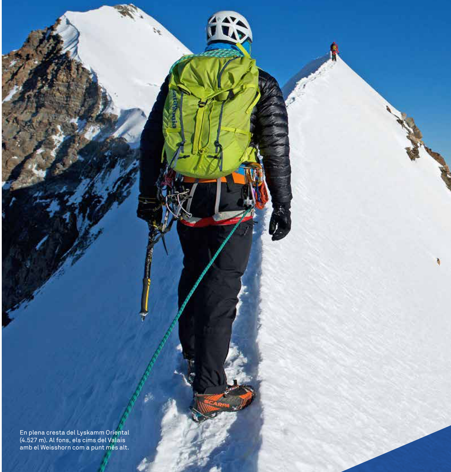
En plena cresta del Lyskamm Oriental (4.527 m). Al fons, els cims del Valais amb el Weisshorn com a punt més alt.