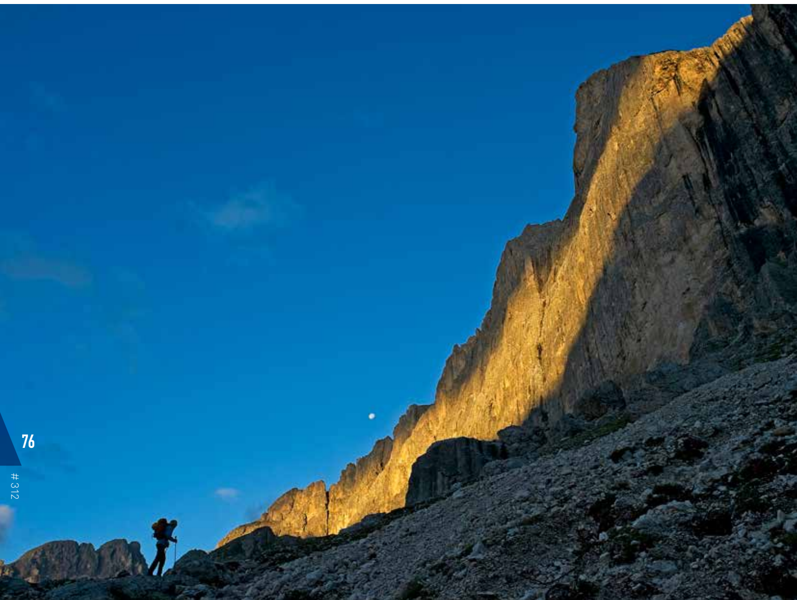
Camí del Passo delle Coronelle, a primera hora del matí, sota la il·luminada paret sud del Catinaccio.