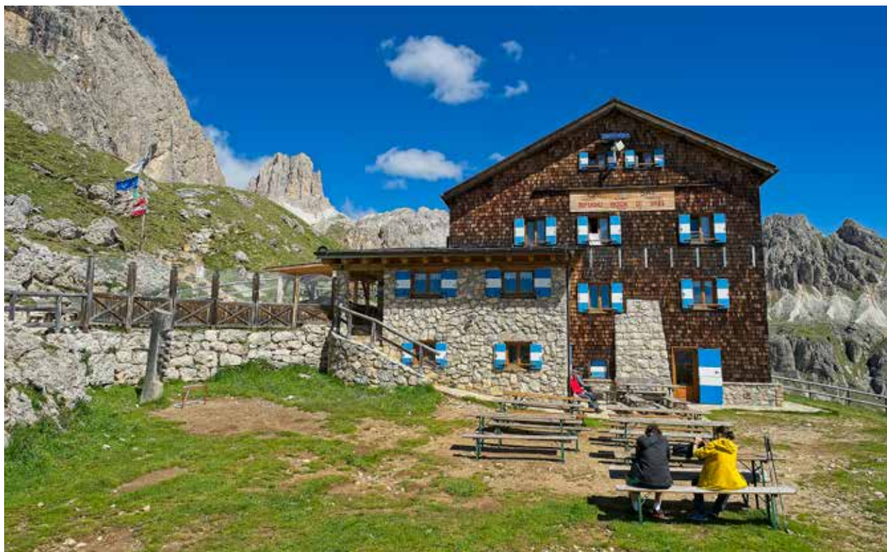
El refugi Roda di Vael, punt de sortida de les vies ferrades de l'extrem sud del massís de Catinaccio.

Entre la Val di Fassa i la població de Bolzano, el massís del Catinaccio obre les portes d'un paradís dolomític al Tirol del Sud. Quatre refugis, moltes torres rocoses, un tresmil i diverses vies ferrades configuren l'eix conductor d'una travessa per una de les zones més cobejades de les Dolomites.