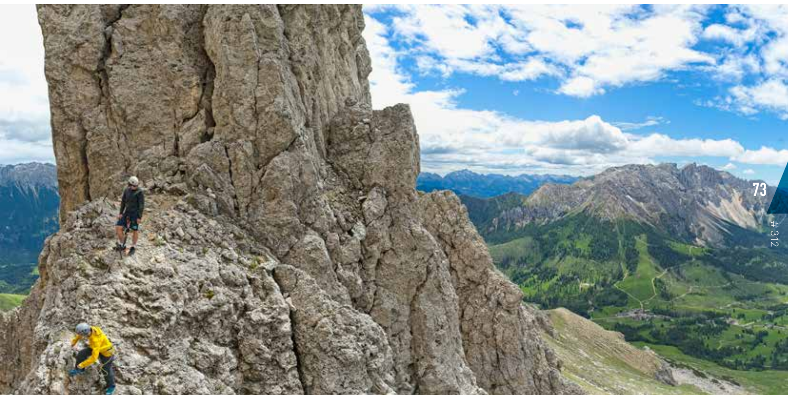
Un dels passos aeris de la via ferrada Masaré, al grup de Roda di Vael.

camins del massís poden patir modificacions per esllavissades. Convé informar-se'n i estar atents a possibles desviacions. No infralloreu les vies ferrades, sobretot de baixada. L'ambient de la zona és alpí i cal estar atents a no moure pedres per no ferir altres cordades. Els refugis tenen horaris de cuina diferents dels nostres; consulteu-los per no quedar-vos sense sopar; i reserveu abans, sobretot si hi aneu a l'agost! Per últim, no us oblideu de visitar el llac de Carezza al capvespre, quan la paret oest del Latemar s'il·lumina i es reflecteix a les seves aigües.